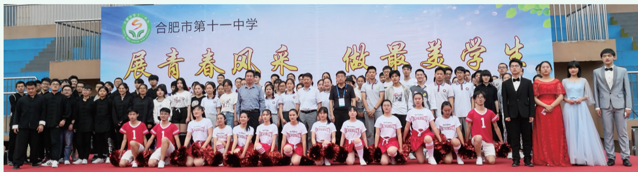
美丽学生评选暨社团活动展演

作为一所优秀的省级示范高中，近几年，合肥市第十一中学教育教学质量不断攀升，学生综合素质不断提高。2017年至2019年，合肥十一中连续三年荣获合肥市普通高中教育教学质量综合评价一等奖并获得学生特长发展专项优胜奖，获得了家长的一致赞誉和社会的广泛好评。成绩的背后是十一中科学有效的精细化管理，是学校“内提外引”强化师资队伍建设的决心和恒心，是老师们不气馁、不松懈，狠抓各层次提高率的拼搏精神。 □潘妥