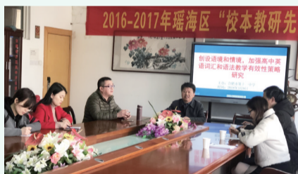
校领导指导英语市级课题结题

正是因为有了这样一支业务精湛的师资队伍，全体教师凝心聚力，立足三年抓高考，坚持“有效备课”“有效上课”“有效复习”“有效作业”“有效命题与评价”，狠抓各层次学生提高率，使得学校高考成绩年年创新高，充分彰显了“低进中出、中进优出，优进高出”的质量特色。