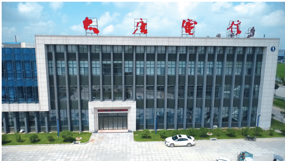
安徽大唐融合信息技术有限公司