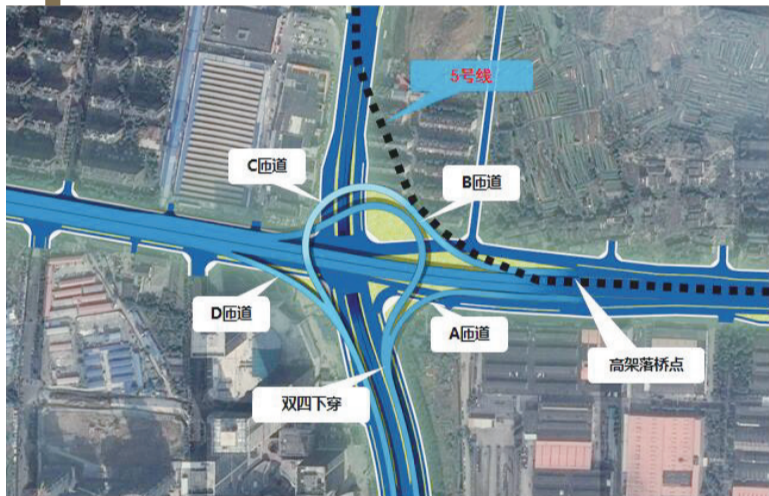
宿松路节点总体设计