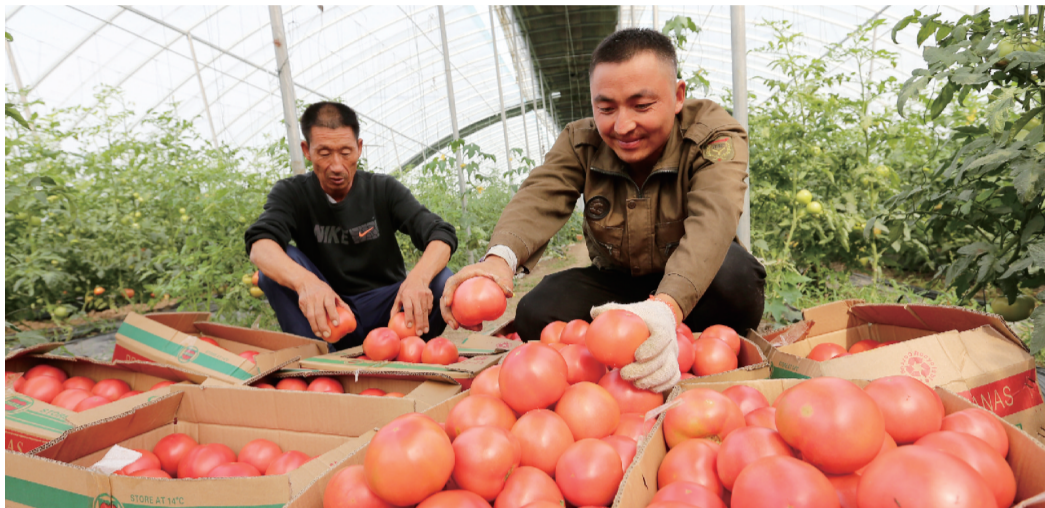
村民在孙疃镇扶贫产业园采摘西红柿