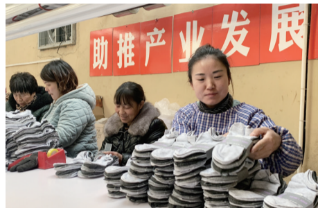
临涣镇临南村就业扶贫车间建到家门口

结合排查走访,摸排筛查扶贫短板特别是贫困户“两不愁三保障”等方面存在的短板,有针对性落实整改措施。强化危房改造。印发《濉溪县2020年农村危房改造实施方案》《关于进一步加强四类重点人群住房安全保障工作的实施意见》,对已复核确定的贫困户、低保户、五保户、残疾人户危房全部纳入2020年危房改造计划,积极备足人、机、料等各项生产要素,确保5月底前全面竣工,尽早解决群众居住安全。强化教育资助。对全县5733名建档立卡贫困学生家庭网络情况进行全面摸排,及时掌握贫困学生家庭网络设备情况。免费提供智能手机87部,安装网络300户,解决网络故障11户。强化饮水安全。今年濉溪县将通过新建改扩建水厂5处,提高农村饮水安全保障与服务水平,确保困难群众喝上更加方便、安全、稳定的饮用水。强化社保兜底。印发《濉溪县城乡低保审批权限委托下放工作实施方案的通知》,率先将低保审批权限下放到镇(园区),确保符合条件的困难群众第一时间得到救助。强化临时救助。建立临时救助备用金制度,对在疫情防控期间受影响的贫困家庭及时进行临时救助,确保“两不愁三保障”核心指标不受影响,确保不因疫情而返贫。截至目前,全县共临时救助扶贫对象21户,发放救助金33132元。强化环境整治。深入实施“森林进村庄、经果林进庭院”双进工程,带动全县村庄、道路、沟河、农田林网等国土绿化总量和质量整体提升。