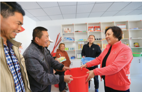
百善镇道口村爱心超市积分兑换现场

用足用好疫情防控期间国家和省市出台的有关支持政策,大力推进产业扶贫、就业扶贫、金融扶贫等脱贫攻坚工程。发起就业攻坚。制定《濉溪县脱贫攻坚就业脱贫重点工作方案》《濉溪县促进贫困劳动力就业创业实施方案》《关于贫困人口外出务工创业交通补助的通知》,与浙江省象山县、义乌市等建立劳务输出合作关系,采取点对点、集中包车等方式,促使未外出务工的贫困劳动力尽快就业,现已开展33批次的集中包车服务。在企业复工复产、重大项目开工等方面,优先组织使用贫困劳动力。组织开展15场“春风行动”等线上招聘会,66家企业共提供就业岗位2950个。9家扶贫车间吸纳87名贫困劳动者就业,带贫率36%。结合公共卫生、消毒保洁、防控宣传等工作,新开发贫困人口临时公益性公益岗位443个。目前全县有务工意愿且有务工条件的贫困人口已全部务工就业。畅通产销对接。推行农资农产品“非接触式”配