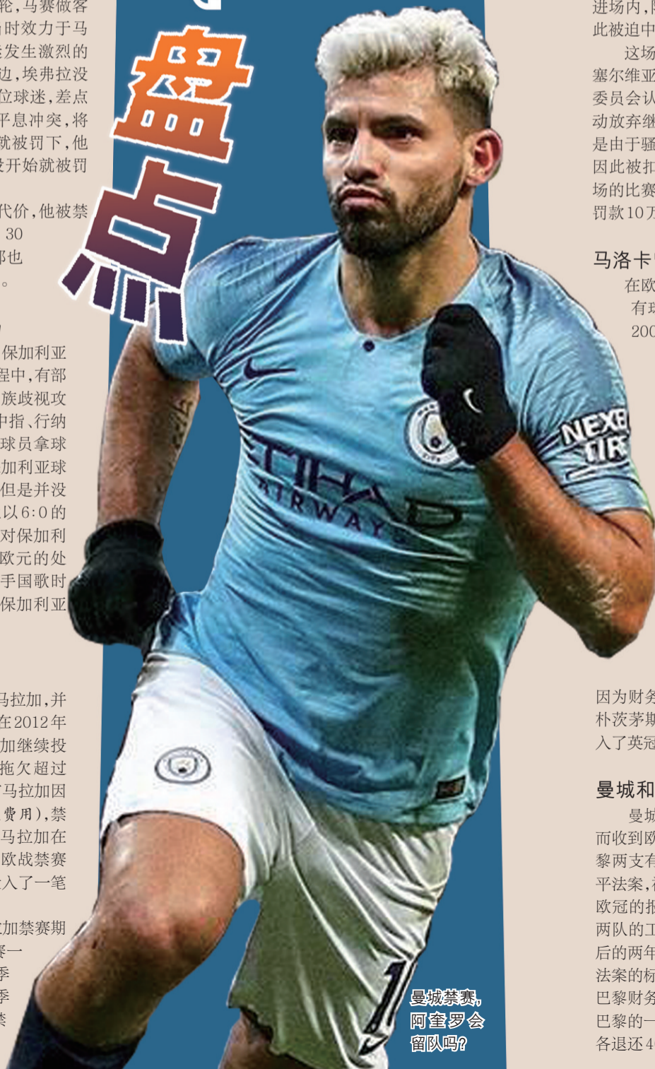
曼城禁赛，阿奎罗会留队吗？