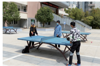
学生在课余时间打乒乓球