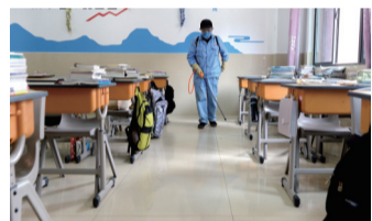
后勤人员在教室里喷洒消毒液