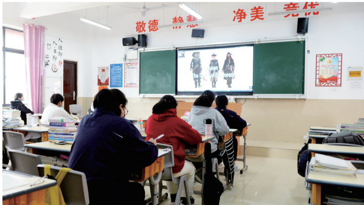
西藏班的藏族学生在教室内上网课