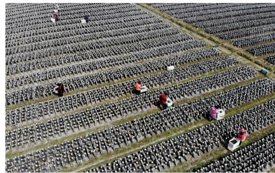
安徽五河:木耳扶贫基地忙采摘

近日,安徽省五河县大新镇府台村木耳扶贫基地的黑木耳迎来采摘期,当地村民在做好疫情防控的同时,到扶贫基地采摘木耳。据介绍,扶贫基地共帮助府台村12户贫困户稳定脱贫,户年均增收2万余元。图为3月11日,村民在府台村木耳扶贫基地内采摘木耳。