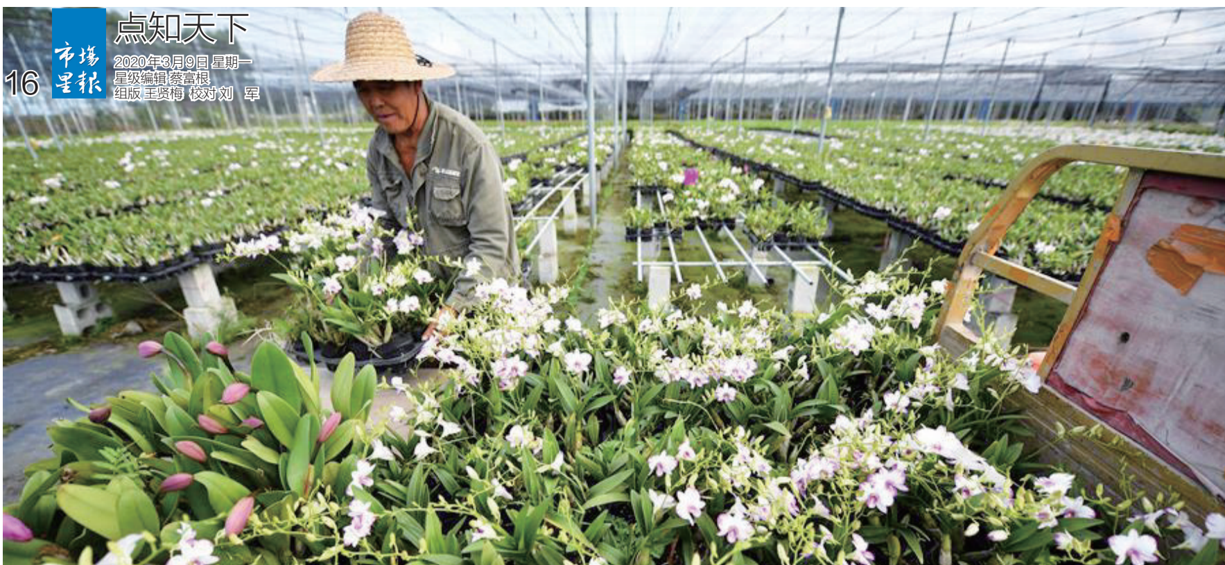
美图 特色农产品基地劳作忙

3月6日,村民在位于海南省东方市的迦南兰花基地搬运兰花。近日,海南省东方市的火龙果、兰花、毛豆等特色农产品基地有序复工复产,田间地头一派繁忙景象。□据新华社